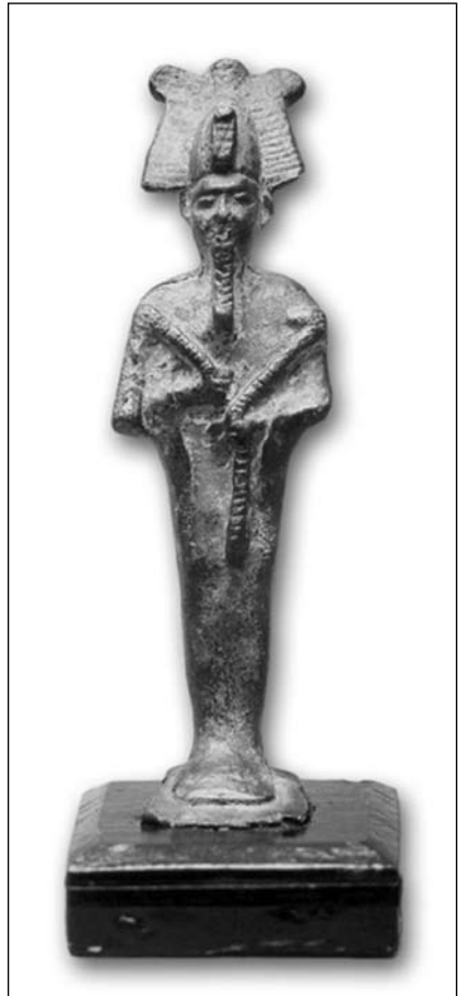
Ил. 5. Бронзова статуетка Осіріса з фондів ЛМІР

Світлина опублікована В. Кропоткіним демонструє зовсім інший тип фігурки. Це також оголений хлопчик, який стоїть на невисокому п'єдесталі кубічної форми. Його права рука оперта на поясицю, у лівій він тримає предмет, який важко