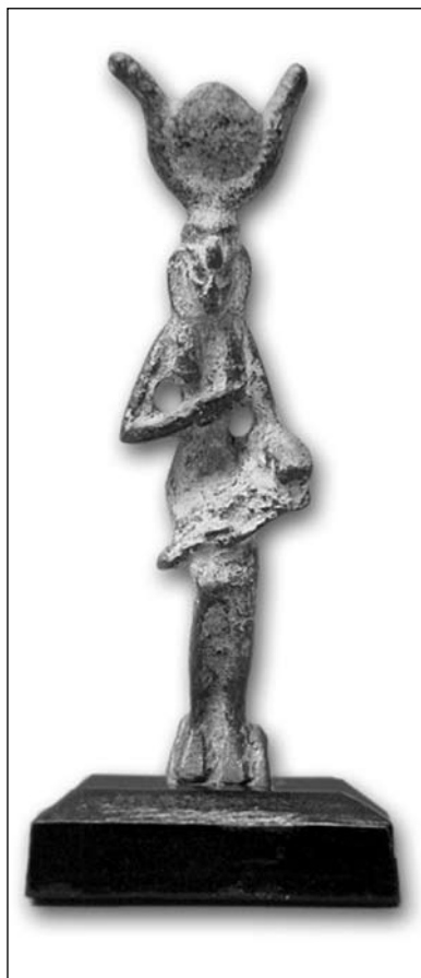
Лл. 6. Бронзова статуетка Ісіді з дитям Гором з фондів ЛМІР

ідентифікувати [15, с. 257 рис. 80/2]. Можливо, це зображення Гора з Києва, інформацію про якого він публікує вперше [15, с. 122, № 1180].