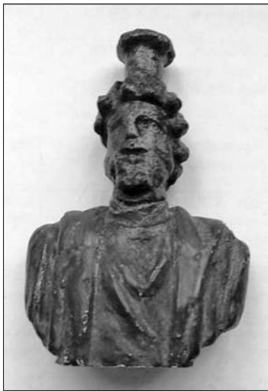
Іл. 3. Фрагмент бронзової статуетки Серапіса з с. Хрінники

напівземлянці-святилищі № 90, разом з матеріалом першої половини III ст. [11, с. 60–65]. Про знахідку згадує також Б. Магомедов [20, с. 180, № 39]. На даний момент фігурка зберігається у фондах Рівненського обласного краєзнавчого музею, інв. № РОКМ КН23518 ПАК 3935 (іл. 3).