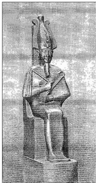
Іл. 4. Зображення скульптури Осіріса з книги Г. Масперо (1895)

Стосовно знахідок з Великої Кам’янки, Києва, Броварів і Пекарів неможливо встановити ані час, ані конкретне місце їхнього виявлення. Натомість статуетки з Синькова, Могильниці, Жабинців і Рівного мають більш-менш відомі